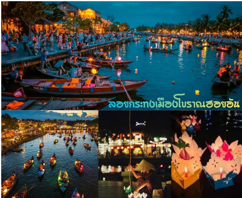
ล่องกระทงเมืองโบราณฮอยอัน

นำท่าน ล่องเรือลอยกระทง ในแม่น้ำหว่าย และเพลิดเพลินไปทั่วทัศนของเมืองโบราณฮอยอันในยามค่ำคืน